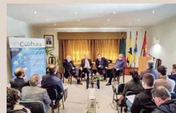
Palestra “Europa: (sempre) na encruzilhada”

A organização esteve a cargo do Núcleo Promotor do Auto da Floripes 5 de Agosto, com o apoio das autarquias de Vila de Punhe, Mujães, União das Freguesias de Barroselas e Carvoeiro, e Câmara Municipal. ■