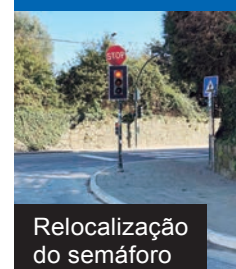
Relocação do semáforo