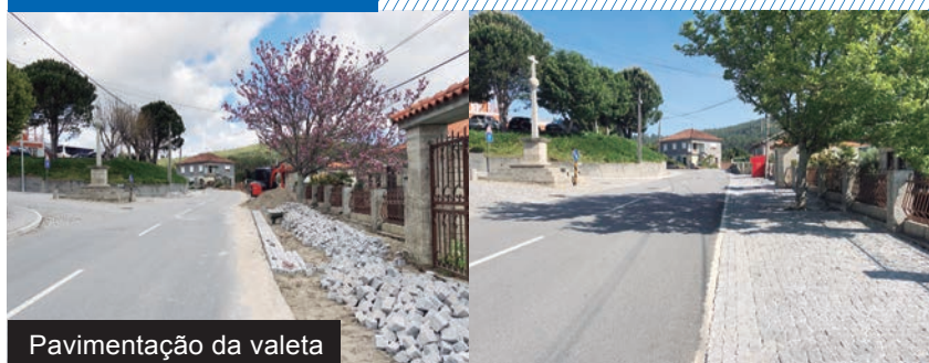
Pavimentação da valeta