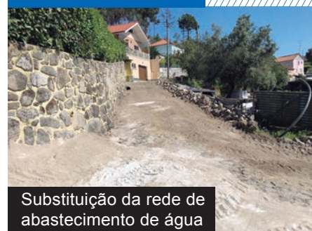
Substituição da rede de abastecimento de água