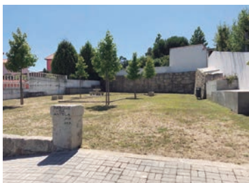
Parque da Antela