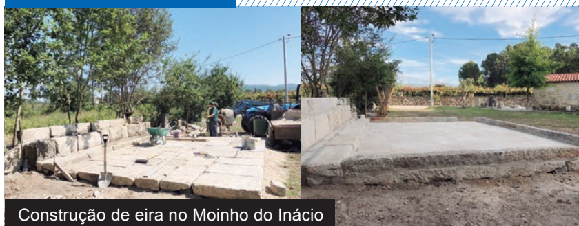
Construção de eira no Moinho do Inácio