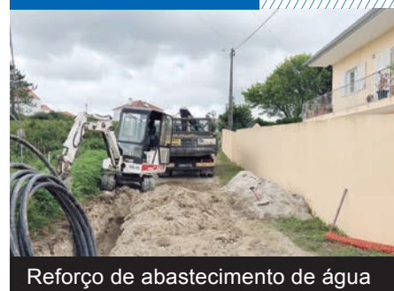
Reforço de abastecimento de água