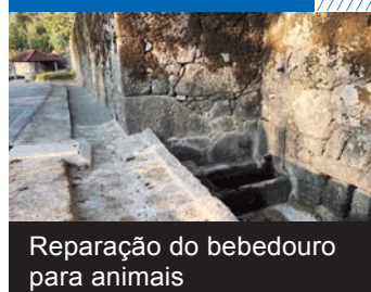
Reparação do bebedouro para animais