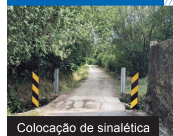
Colocação de sinalética