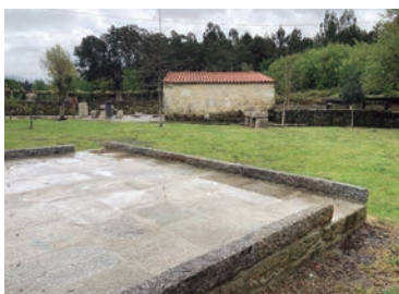
Eira no Moinho do Inácio