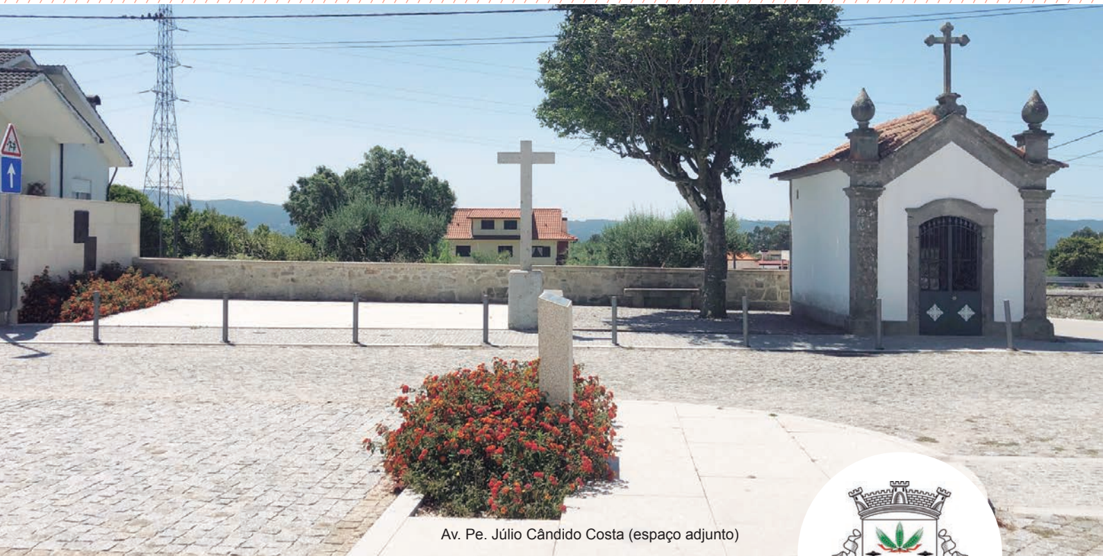
Av. Pe. Júlio Cândido Costa (espaço adjunto)