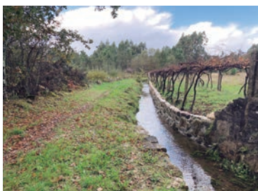
Regato das Boucinhas