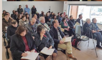
Palestra “Carlos Magno e o Império Carolíngio”