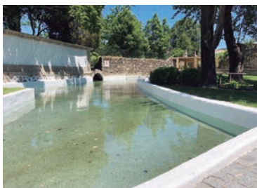
Parque do Bonfim

Locais bastante atrativos para lazer, que proporcionam boas condições para realização de atividades ao ar livre (passeios, manutenção física, piqueniques, etc). ■